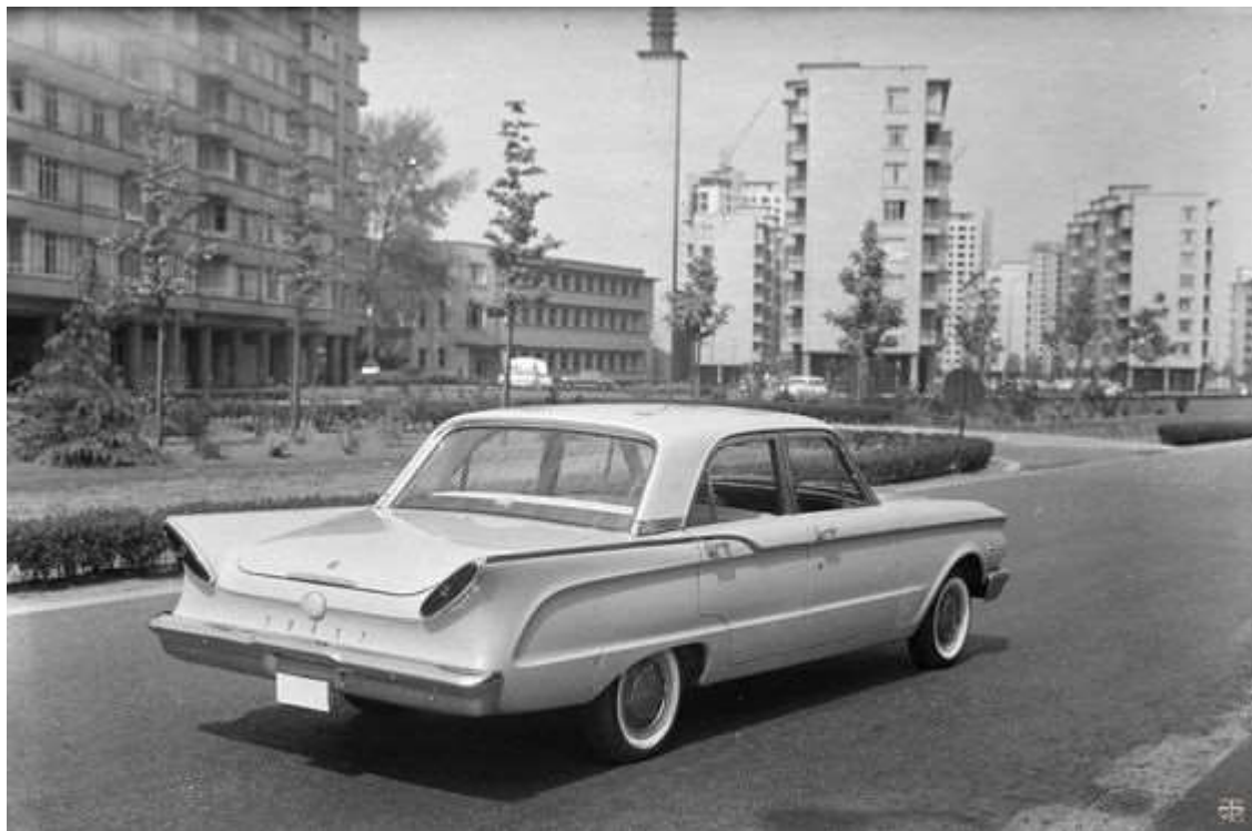
Moderne auto rond moderne architectuur in 1967