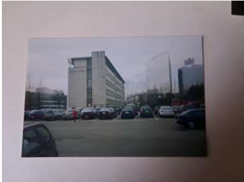
Kinderziekenhuis Louise Marie. 1959- 1997