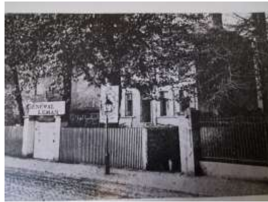
Doorneleitje met links lusthof Hens

Doorneleitje voor de verbreding. Kant Generaal Lemanstraat. Felixarchief GP#4968