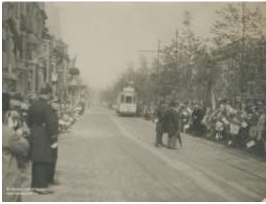
Jan Van Rijswijcklaan met tramlijn aan de buitenzijde van de wandelweg. Wachtende mensen om de koning en de koningin toe te juichen. Felixarchief Foto#11753