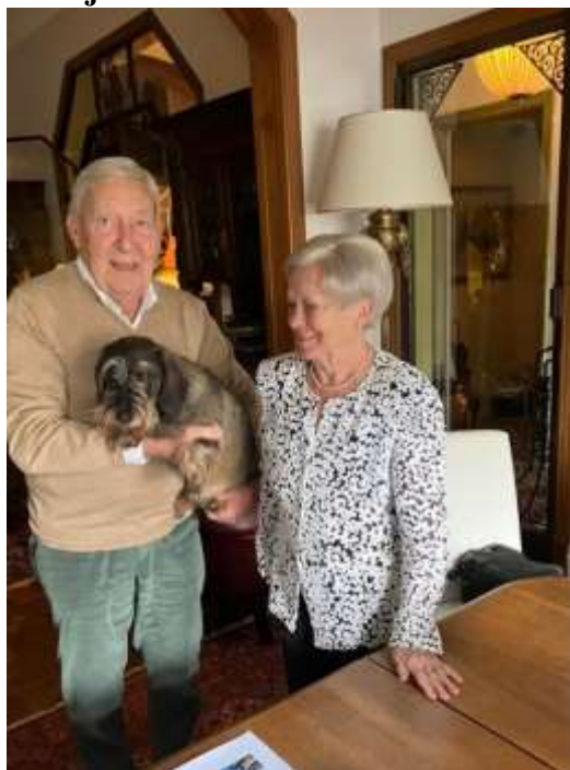
Karel Oomsstraat 6