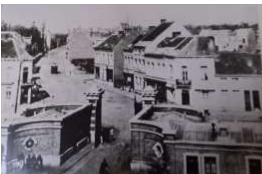
Toegang Masschelinkazerne aan de Generaal Lemanstraat. Afgebroken voor