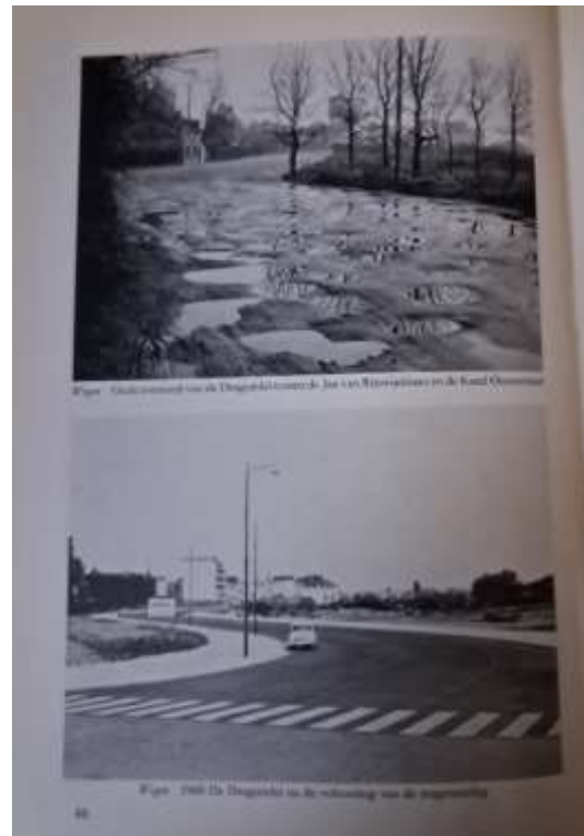
Desguinlei tussen Karel Oomsstraat van aardeweg naar asfaltweg. Aanleg 1957-1960

de verbreding van de Desguinlei 1957-60.