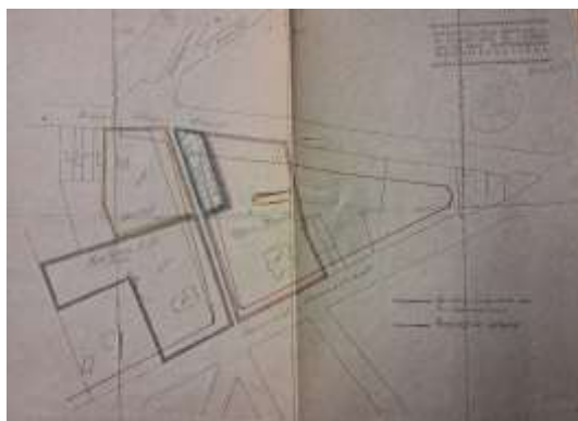
Boordeigenaars Doornelei 1925