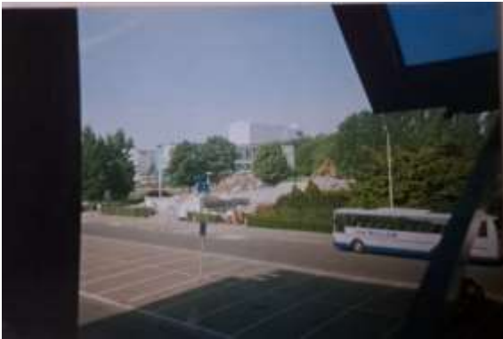
Middenbermparking Karel Oomsstraat. Van de wandelweg richting Nachtegalenpark is geen sprake meer.