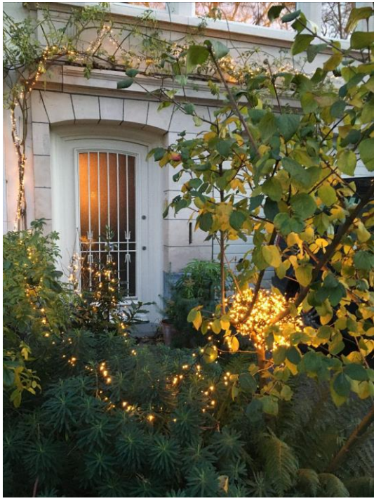
De Jan Van Rijswijcklaan verrast de buurt met kerstbomen en lichtjes op straat.