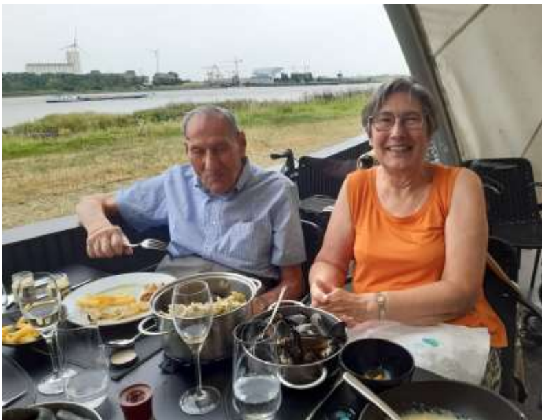
Mosselen eten op linkeroever