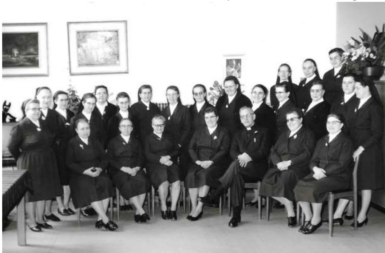
De zusters Annonciaden in 1975

De betalende en kosteloze afdelingen smelten samen tot één vrije gesubsidieerde basisschool voor meisjes. Het dalende leerlingenaantal in de beroepsafdeling kleding wordt gecompenseerd door de oprichting van een handelsafdeling en een afdeling "bureelwerken". In 1974 maakt het internaat plaats voor een kinderdagverblijf.