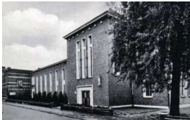
1960 St.Joanna voorgevel

met het Sint-Teresia Instituut van de Zusters Apostolinnen in de Diksmuidelaan tot VTOM, Vrij Technisch Onderwijs Meisjes. De directie is in handen van leken.