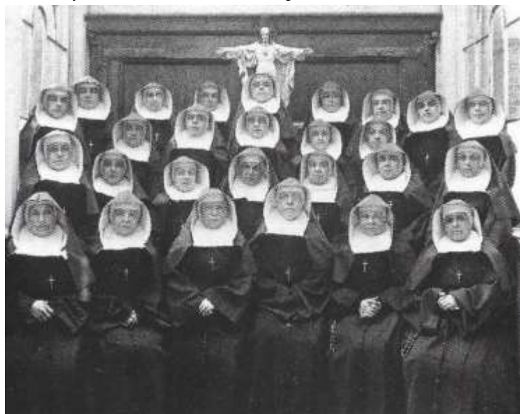
De zusters Annonciaden in mei 1922

Door de grote bevolkingsgroei in Berchem groeit de nood aan middelbaar onderwijs. De zusters staan klaar om dat te organiseren, maar de opdracht gaat naar de zusters van de Heilige Familie uit Tielt die in 1905 in de Sint-Hubertusstraat het "Pensionnat des Dames de la Sainte Famille" oprichten. In november 1914 openen, ondanks de moeilijke oorlogsomstandigheden, de zusters Annonciaden van Berchem een beroepsschool voor meisjes, die in het interbellum tot grote bloei komt.