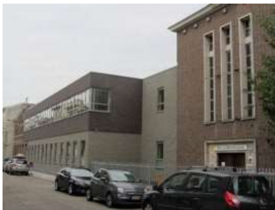
dezelfde voorgevel anno 2024

In 1990 fusioneert VTOM met het Sint-Stanislascollege aan het Van Hombeeckplein en de Heilig Hartschool uit de Lamorinièrestraat tot het Sint-Willebrordcollege, dat op zijn beurt in 2001 fusioneert met de Heilige Familie uit de Jan Moorkensstraat tot Sint-Willebrord – Heilige Familie of Wilfam. In 1992 fusioneren ook de basisscholen van Sint-Joanna en Sint-Stanislas. Vandaag herbergt het voormalige Sint-Joanna basisschool De Schatkist en een afdeling van Wilfam. De zusters blijven met hun hart bij de school en helpen en steunen ze waar ze kunnen. Parallel met het onderwijsgebeuren veroudert en verkleint de congregatie. Zorg voor oudere zusters neemt meer tijd in beslag naast inzet voor parochie, zieken en armen. Maar de jubilea van de congregatie, zoals de 150-jarige aanwezigheid van de zusters in Berchem in 1998, worden uitgebreid gevierd, terwijl elk jaar op 17 november de slachtoffers van de V2 worden herdacht.