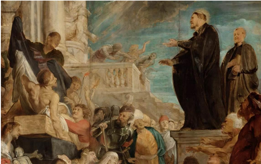
De wonderen van de heilige Franciscus Xaverius door Peter Paul Rubens uit het Kunsthistorische Museum Wien, nu te zien in het Snijders&Rockoxhuis.