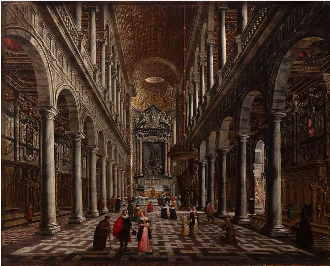
Rubens, Wilhelm Schubert van Ehrenberg, 1668