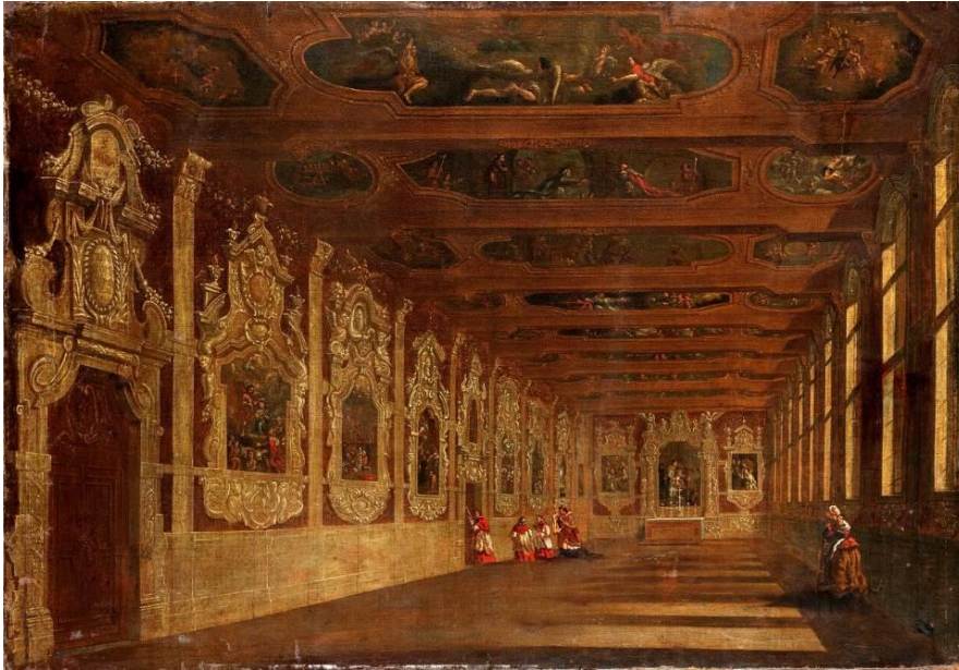
Interieur van de Bovensodaliteit, na 1710 (Antwerpen, privécollectie).

Wie de afbeelding hierboven bekijkt, ziet maar weinig gelijkenissen met de afbeelding hieronder. Toch is dit dezelfde locatie, naast de Carolus Borromeuskerk aan het Conscienceplein. Vandaag is het de stemmige Nottebohmzaal in de erfgoedbibliotheek Hendrik Conscience, met houten meubels, gedempt licht, een krakende vloer en oude boeken, verspreid over twee verdiepingen.