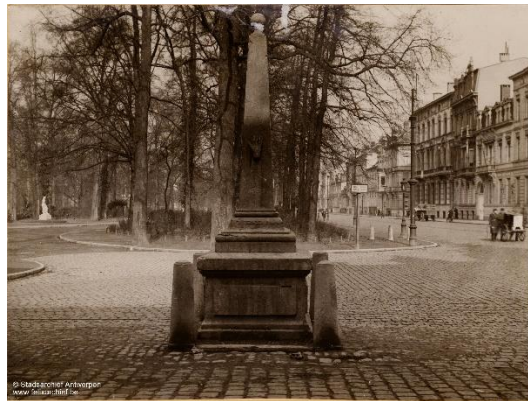
Grenspaal van Berchem in 1929