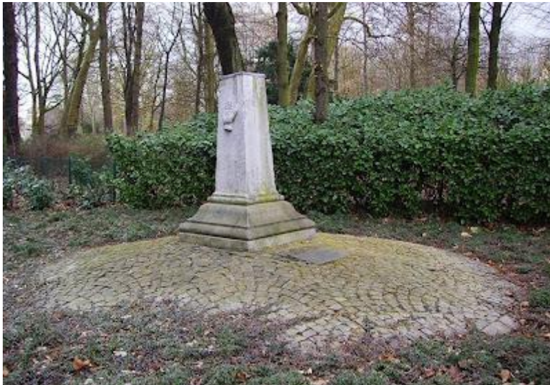
Grenspaal van Berchem na 2002