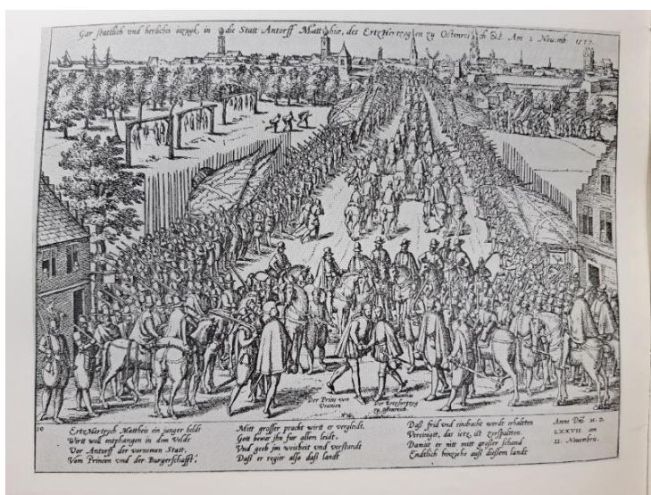
De intocht van Matthias van Oostenrijk in Antwerpen (1577) aan de grenspaal van Berchem