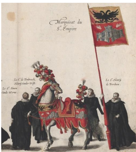
de markies van Antwerpen gesymboliseerd in de begrafenisstoet van Albert VII, aartshertog van Oostenrijk en landvoogd van de Zuidelijke Nederlanden.