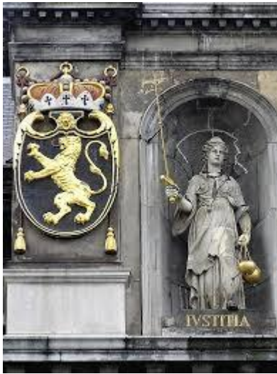
wapenschild van Brabant op de voorgevel links van het Antwerps stadhuis