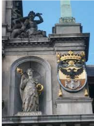
wapenschild van het markgraafschap Antwerpen op de voorgevel rechts van het Antwerps stadhuis