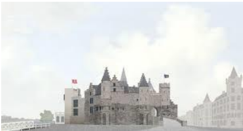
Het Steen van Antwerpen na renovatie in 2021