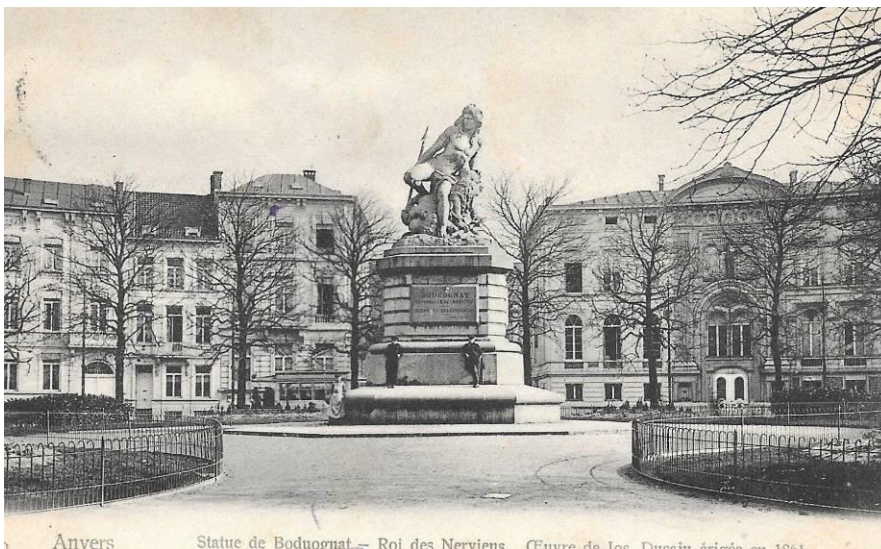
Rondpunt Belgiëlei met vooraan het indrukwekkende beeld van Boduognat. Rechts de imposante gevel van Victor Lynen.