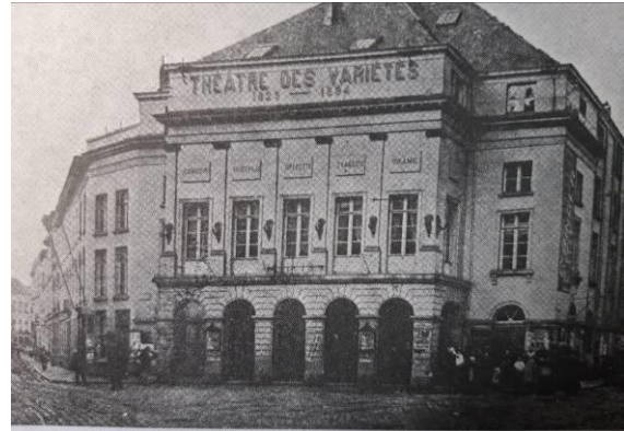
Théâtre des Variétés