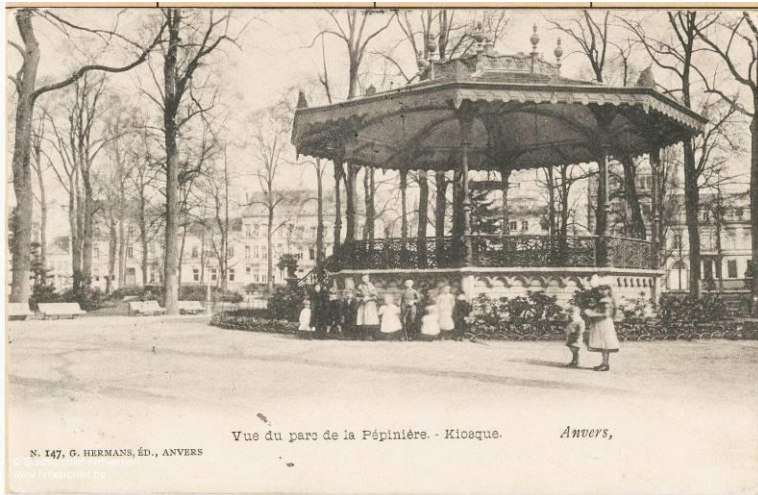
Kiosk Koning Albertpark

In de 19 de eeuw ontstonden ook tal van harmonieën, fanfares en muziekkapellen. Er is geen dorp of stad in België of het heeft één of meerdere muziekkiosken. Tussen 1890-1900 waren er meer dan 150 muziek- en zangverenigingen in de Provincie Antwerpen. In 1842 opende de Ecole spéciale de musique de la Ville d'Anvers haar deuren als privé initiatief. In 1859 wordt het de Stedelijke Muziekschool van Antwerpen. In 1867 werd aan Peter Benoit gevraagd om directeur te worden. In 1898 werd door zijn toedoen het Koninklijk Vlaams Conservatorium gesticht. Momenteel gehuisvest op de Desguinlei met opleidingen voor Dans, Drama en Muziek met een belangrijke conservatoriumbibliotheek en architectuurinstituut. Alles gevat in het prachtige gebouwencomplex van de Singel.