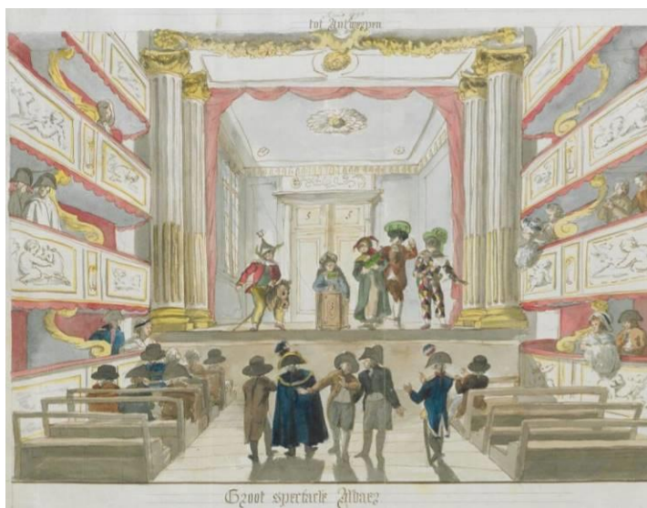
aquarel van de schouwburgzaal van Pierre Goetsbloets (1794-97)