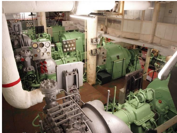
Gedeelte van de Machinekamer totale lengte 90 meter

In de middag na de lunch was er voor belangstellenden een excursie in de machinekamer, die werd geleid door één van de 3de machinisten en die had met mij een speciale afspraak.