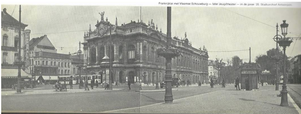
Vlaamse Schouwburg aan het Kipdorpbrug