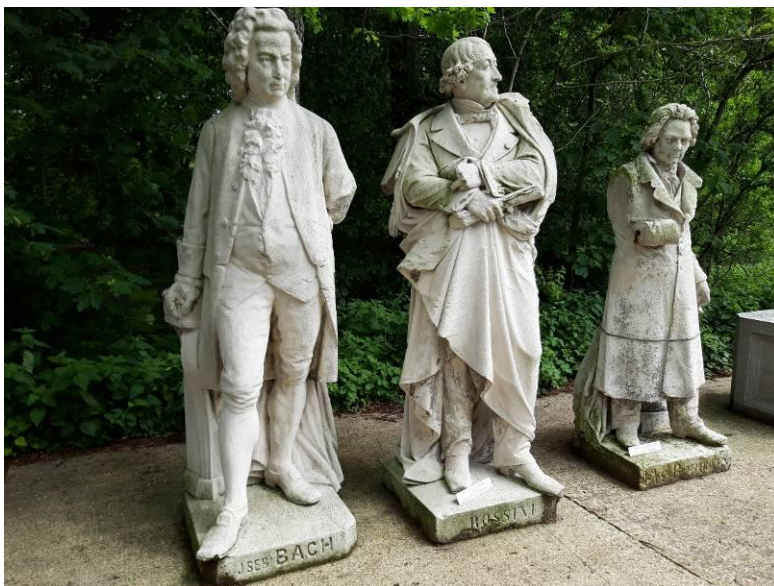
Bach, Rossini en Von Beethoven

In 1914 wilde men de huidige Harmoniezaal afbreken voor nog een prestigieuzere zaal. Aanleiding was het 100 jarig bestaan. Het uitbreken van WO I heeft daar een stokje voorgestoken. De kapitaalkrachtige Duitse sponsors hadden nu andere zorgen. Blijven of vertrekken. De Société Royale d'Harmonie bestaat nog onder de naam vzw Sorodha. Zij zetten zich nog altijd in voor het muziekleven in Antwerpen in de