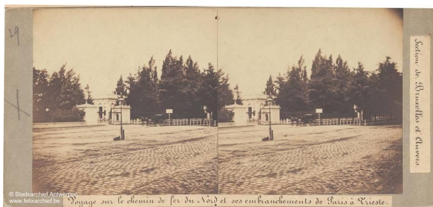
Mechelse Steenweg met toegangsgebouwen Harmonie