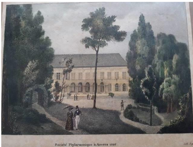
1829 Bezoek van Koning Willem II aan het zomerlokaal in het Hof ter Beke

zomerlokaal van de Société d' Harmonie op de grond van het hof ter Beke