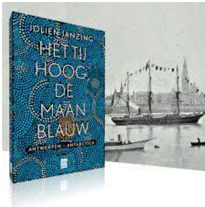
cover Het tij hoog, de maan blauw