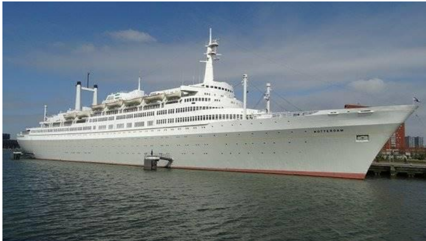
s.s. Rotterdam Holland Amerika lijn

In 1962 heb ik een half jaar op de “Rotterdam” gevaren, het schip was toen ongeveer twee jaar in de vaart, dus in onze ogen “brand new”.