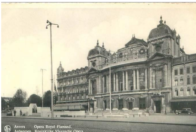
Koninklijke Vlaamse Opera met standbeeld van Peter Benoit op de Frankrijklei.