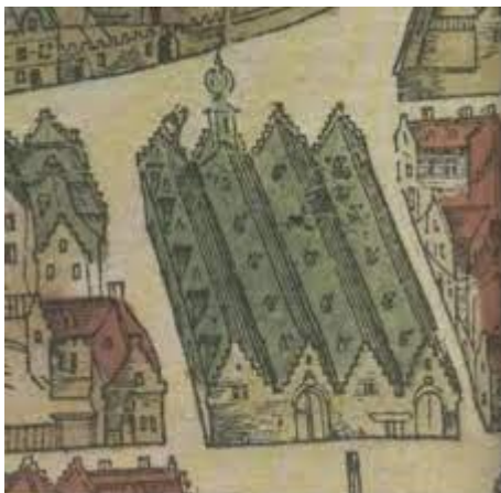
cover boek Franse Revolutie in Antwerpen