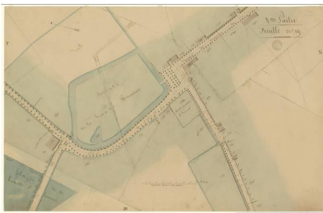
domein Hof ter Beke in 1840. Het zomerlokaal staat niet meer op de kaart getekend

Van Gleesen. Waar en wie dit was hebben we nog niet kunnen achterhalen. Het zou kunnen, want in 1832 zijn er zware beschietingen vanuit het Zuidkasteel op Antwerpen en omgeving. Veel eigendommen in de Ley zijn beschadigd. Op een platte grond van 1840 staat zelfs het zomerlokaal er niet meer opgetekend.