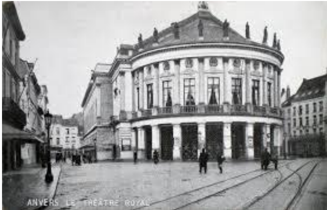
Théâtre Royale, nu de Bourlaschouwburg genoemd

In 1829 werd onder Nederlands bewind het Théâtre Royal Français gebouwd door stadsarchitect Pierre Bourla (ook een ingeweken Fransman) . Tussendoor had men nog een Théâtre des Variétés gebouwd aan de Maarschalk Gérardstraat. En in 1874 De Vlaamse Schouwburg aan de Kipdorpbrug en in 1904 De Koninklijke Vlaamse Opera.