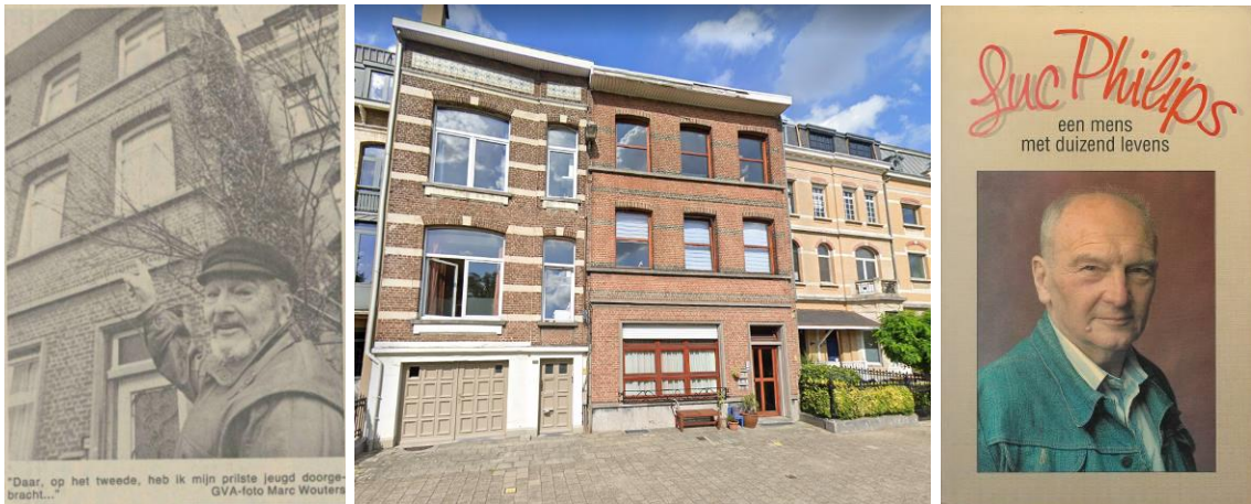
Foto 1 Luc Philips voor zijn raam in 1990 op de Desguinlei 72

Of denkt het te weten, want alle verhalen worden wat aangedikt.