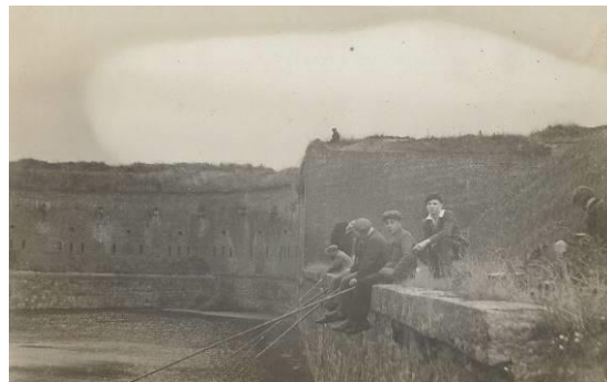
Foto 7: Wilrijkse Poort met tram 5 - Foto 8: kinderen op de Kazematten van de Wilrijkse Vest