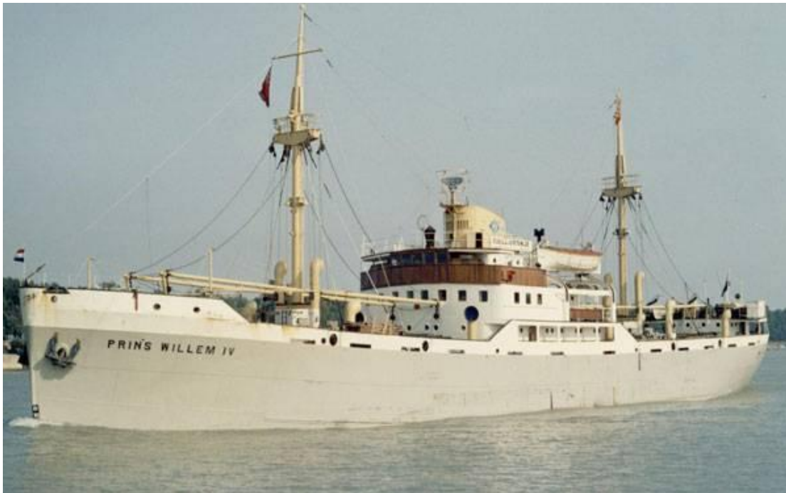
m.s. Prins Willem IV

De Prins Willem IV was een van de prettigste schepen waarop ik gevaren heb. Het was een half vracht half passagiers schip en we voeren tussen Glasgow (Schotland) en de Canadese & Amerikaanse meren.