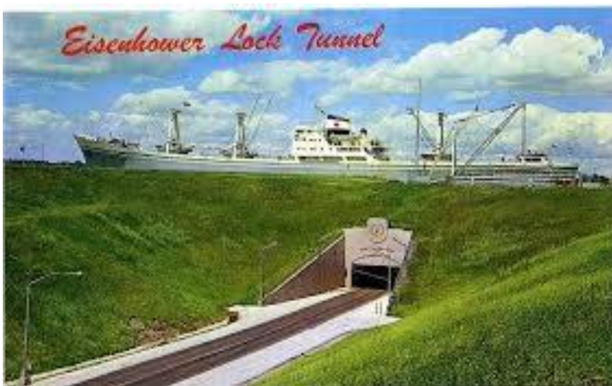
De Eisenhower tunnel onder de Lawrence Seaway .

We hadden ook meestal goed weer, de Lawrence Seaway was alleen zomers bevaarbaar want 's winters vroom de rivier en de meren dicht en werd door het ijs onbevaarbaar.