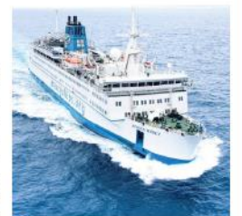
› Het ziekenhuisschip heeft de beste medische apparatuur en chirurgen.

Mercy Ships vaart met een volledig operationeel ziekenhuisschip naar de allerarmsten. Er kan onmiddellijk medische hulp geboden worden. Vanaf dag één onderzoeken de vrijwillige gezondheidswerkers patiënten en behandelen zo snel mogelijk de dringendste gevallen. Het private ziekenhuisschip heeft de beste medische apparatuur en de meest ervaren chirurgen. Doordat iedereen vrijwillig werkt, gaat zoveel mogelijk geld naar de aankoop van medisch materiaal, patiëntenzorg en lokale projecten. Er wordt pas aangelegd in een land na een minutieuze voorbereiding. Elk verblijf duurt ongeveer tien maanden. Na het vertrek van het schip laat Mercy Ships niet alleen hoop en genezing achter voor vele duizenden